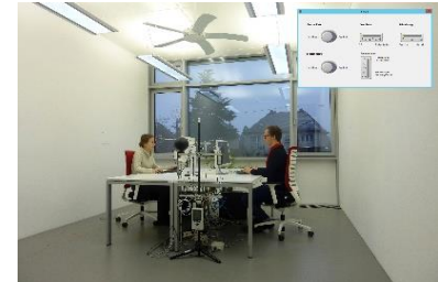
Bei dem Forschungsprojekt der IEA werden nicht nur Daten zu Komfortparametern erhoben, sondern gleichzeitig die menschliche Interaktion mit den Nutzerschnittstellen untersucht (Foto/Montage: KIT).

Ziel des Forschungsprojektes sind neben der erkenntnisorientierten Forschung auch praktische Empfehlungen für das Design und den Betrieb von Gebäuden, die ein sparsames Verhalten fördern. Bereits seit 1977 berät die IEA Regierungen und andere Stakeholder wie die Bauindustrie auf dem Gebiet der Energieeffizienz. Ihre Empfehlungen basieren dabei auf dem Forschungsprogramm des „Implementing Agreement on Energy in Buildings and Communities“ (EBC) mit 26 Mitgliedsstaaten. Gemeinsam mit Wissenschaftlerinnen und Wissenschaftlern aus mindestens 14 Nationen erarbeiten Andreas Wagner und Liam O'Brien mit dem neuen Forschungsprojekt nun die wissenschaftlichen Grundlagen für ein so genanntes Annex zu dieser Vereinbarung.