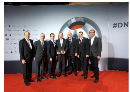
Deutscher Nachhaltigkeitspreis in der Kategorie Forschung: Die Gewinner bei der Preisverleihung in Düsseldorf.

Weitere Informationen zum Deutschen Nachhaltigkeitspreis: https://www.nachhaltigkeitspreis.de/