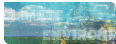
KIT-Zentrum Klima und Umwelt: Für eine lebenswerte Umwelt