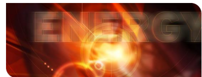
KIT-Zentrum Energie: Zukunft im Blick

Stromspeicher sind ein wichtiger Baustein für die deutsche Energiewende. Sie speichern Überschüsse aus den unregelmäßig anfallenden Erträgen aus Sonne und Wind und speisen sie bei Bedarf wieder in die Stromnetze ein. In immer mehr privaten Haushalten kommen inzwischen Heimspeicher zum Einsatz, um Strom aus Photovoltaik-Anlagen zwischenspeichern. Statt Strom aus dem Netz zu beziehen, können die Haushalte sich mit immer mehr selbst erzeugter erneuerbarer Energie versorgen.