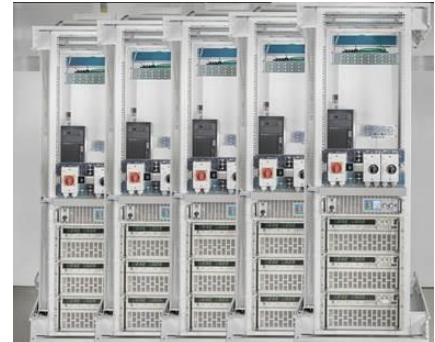
An über 20 Testständen untersucht das Projekt „SafetyFirst“ Sicherheit, Qualität und Netzdienlichkeit von Heimspeichern für Strom aus Photovoltaikanlagen. (Bildmontage: KIT).

Ergänzend zu den Untersuchungen an ganzen Heimspeichern werden einzelne ausgewählte Lithium-Ionen-Zellen am Fraunhofer-Institut für Solare Energiesysteme und am Zentrum für Sonnenenergie- und Wasserstoffforschung untersucht. Parallel zu den Experimenten