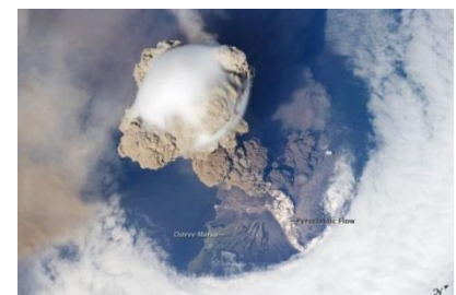
Der Vulkan Sarytschew im frühen Stadium der Eruption vom 12. Juni 2009.