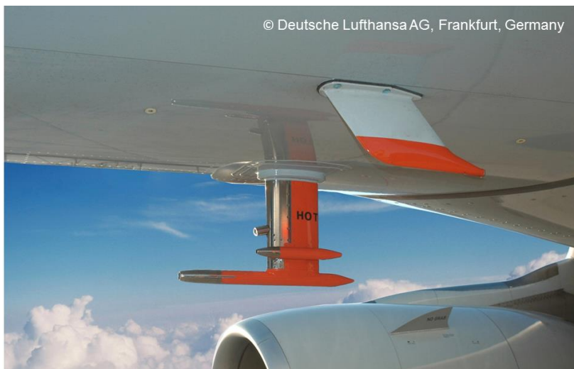
Das für IAGOS-CARIBIC entwickelte Einlasssystem am IAGOS-CARIBIC Airbus.

Reduzierte Sonneneinstrahlung durch Partikel aus Vulkanausbrüchen verhinderte in den letzten zehn Jahren ein stärkeres Ansteigen der Temperaturen