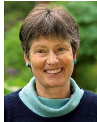
Eröffnungsrednerin des Colloquiums: Die BUND Ehrenvorsitzende, Profes- sor Angelika Zahrt

Das Colloquium Fundamentale findet an ausgesuchten Donnerstagen jeweils um 18.00 Uhr im NTI-Hörsaal, KIT-Campus Süd , Gebäude 30.10, Engesserstraße 5, statt. Der Eintritt ist frei.